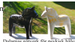
Dalarnas nätverk för psykisk hälsa

Vi har några platser kvar i bussen, säg till om du vill följa med.