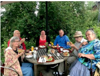
Hjort Olårs kafé