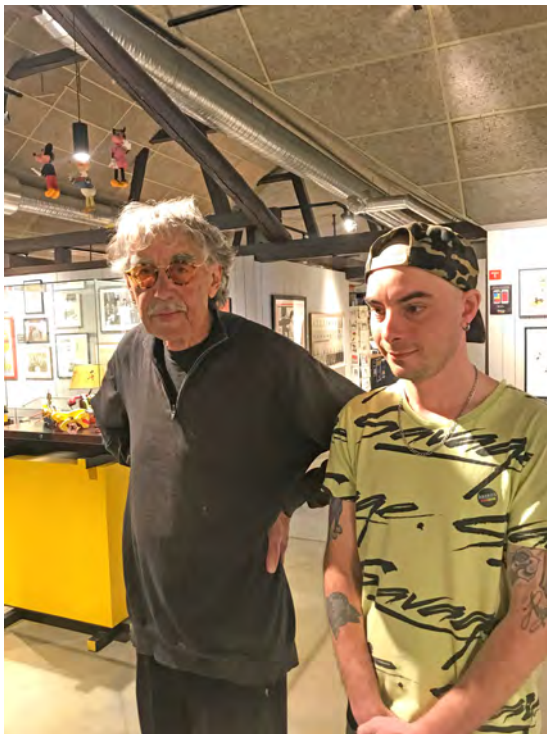
Studieresa Målarcirkel Lasse Åbergs museum 8 maj.