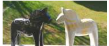
Dalarnas nätverk för psykisk hälsa

Under april månad så kan Du som tar emot vårdinsatser, slutenvård eller från öppenvård psykiatri i Dalarna hjälpa oss. Det kommer att finnas enkäter på RSMH-Hoppet med några få frågor, de kan du sedan lägga i anonymt i en låda, som det står "Enkät" Framtidens psykiatri på. Du som inte kommer till lokalen, kan ringa och skicka efter enkäten digitalt eller med post. Du hjälper då "Nätverket" så att vi kan analysera hur psykiatri ser ut i Region Dalarna idag, från alla föreningar i "Nätverket". Vi tar sedan pulsen på politikerna med samma frågor till dem. Vad har politikerna för svar, hur vill de forma den framtida psykiatri?