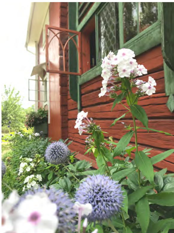
Carl-Larssongården