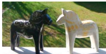
Dalarnas nätverk för psykisk hälsa