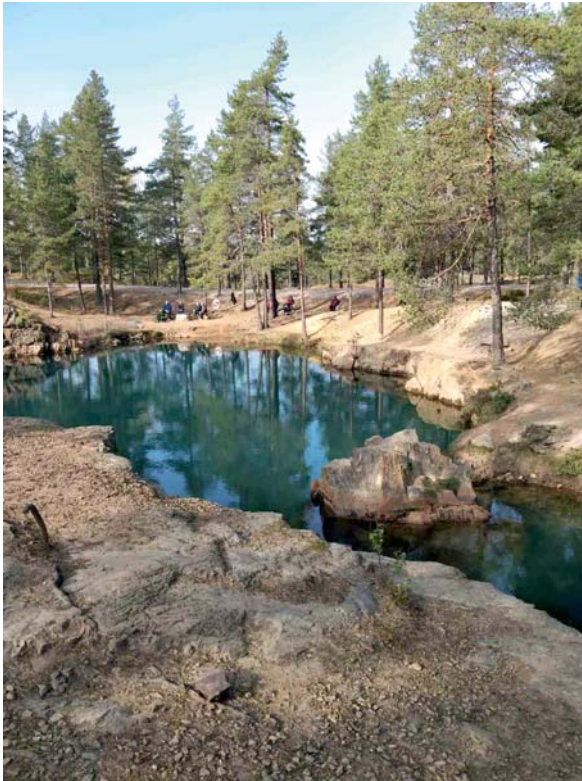
Östra Silvberg 23 sept. 2020