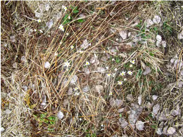
Våren är på väg