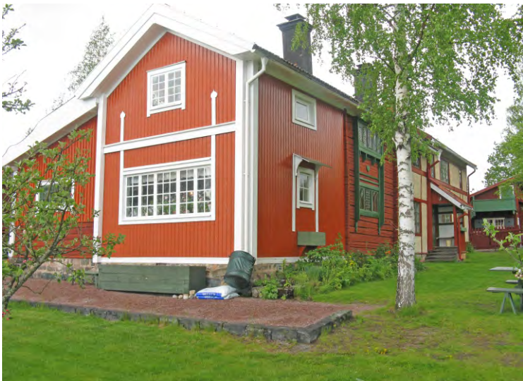
Carl Larssongården 2015