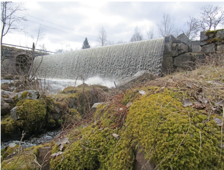
Kloster 16 April